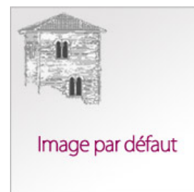
Image par défaut