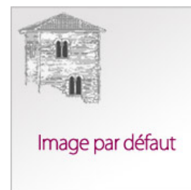
Image par défaut