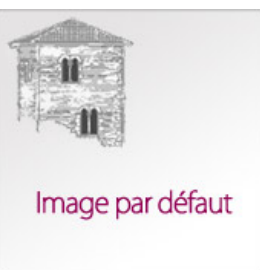
Image par défaut