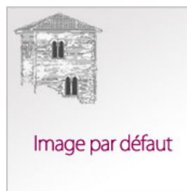
Image par défaut