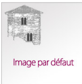
Image par défaut